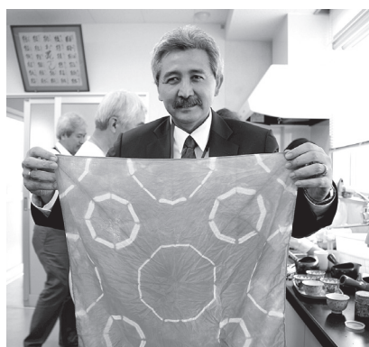
写真2 ヘルマント会長の作品

EAROPHとは、1956年にニューデリーで第1回の設立大会を開催し、アジア、豪州、太平洋地域の全ての国々を対象とする国連に公認されたNGOであり、IFHPとは姉妹提携をしている。その本部は1978年にインドからマレーシアに移された。今回の参加国はオーストラリア、中国、香港、インドネシア、マレーシア、タイ、フィリピン、韓国、日本の8カ国・1地域、参加人数は外国人37名、日本人255名、合計292名であった。外国人の中には佐賀大学、熊本大学、九州大学、大分大学などへの留学生が、日本人の中には塩田工業高等学校の教諭と生徒100名余が含まれている。また、本セミナーのメインテーマは「地域資源を生かした活力ある都市・住宅の形成」、サブテーマを「人間居住・環境」、「医療・観光（温泉を含む）」、「インフラ（交通）とまちづくり」としたが、サブテーマの方は必ずしも明確に区分することはできなかった。