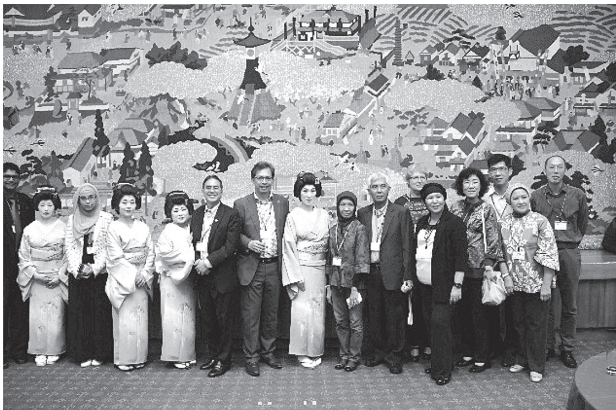
写真7 藤生会の皆さんと記念撮影

研究発表会は大正屋の平安の間と千種の間で開催され、合計22報が発表された。全体としてレベルが高く感じたのは、論文委員が執筆者に相当細かく注文を出した成果だと思われる。発表内容は後日、報告書に収録する。